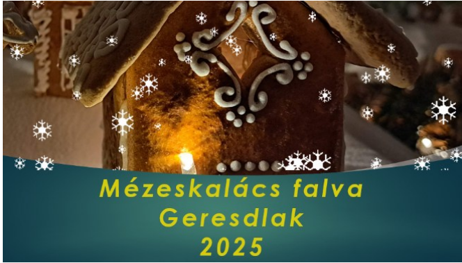
Mézeskalács falva Geresdlak 2025