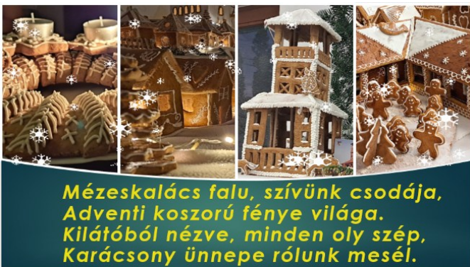
Mézeskalács falu, szívünk csodája, Adventi koszorú fénye világa. Kilátóból nézve, minden oly szép, Karácsony ünnepe rólunk mesél.