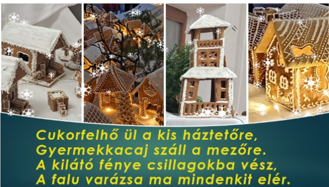
Cukorfelhő ül a kis háztetőre, Gyermek kacaj száll a mezőre. A kilátó fénye csillagokba vész, A falu varázsa ma mindenkit elér.