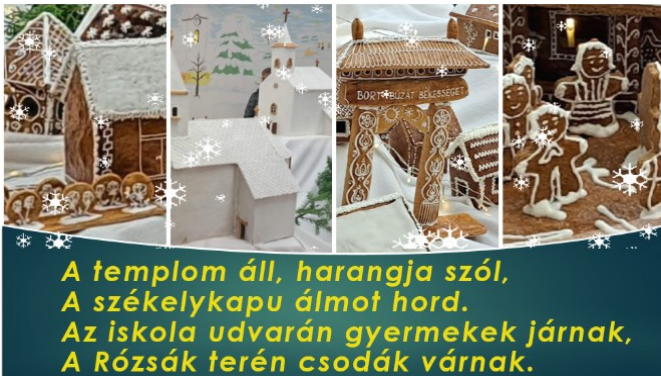
A templom áll, harangja szól, A székelykapu álmot hord. Az iskola udvarán gyermekek járnak, A Rózsák terén csodák várnak.