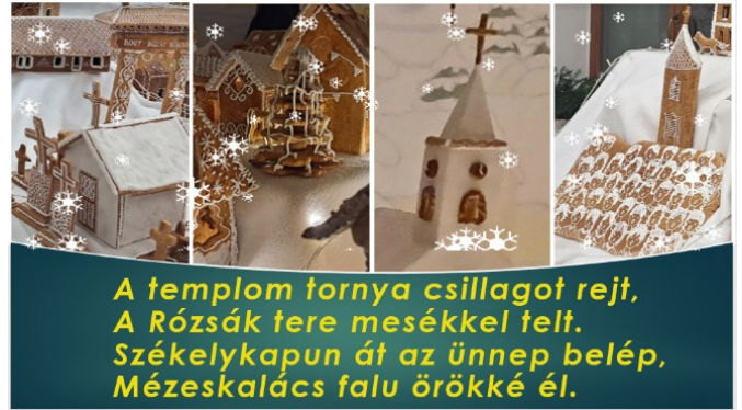
A templom tornya csillagot rejt, A Rózsák tere mesékkel telt. Székelykapun át az ünnep belép, Mézeskalács falu örökké él.