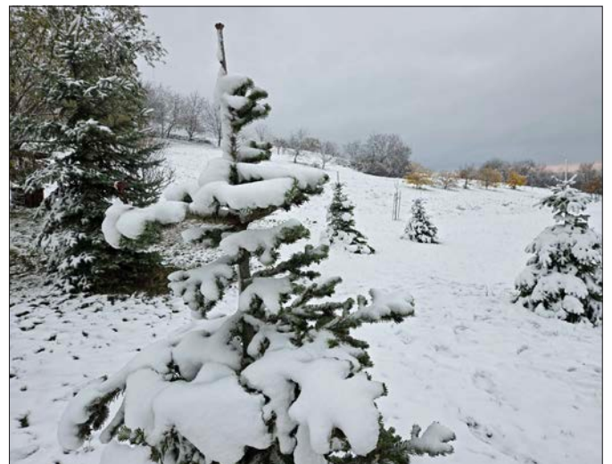
Havas Grinnye! Amikor a tél picit megmutatja szépségét!