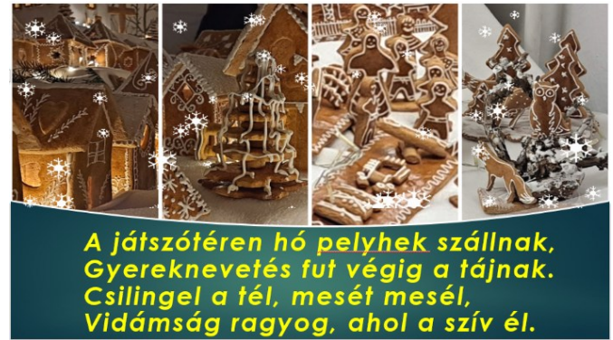
A játszótéren hó pelyhek szállnak, Gyereknevetés fut végig a tájnak. Csilingel a tél, mesét mesél, Vidámság ragyog, ahol a szív él.