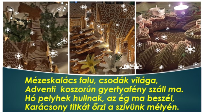
Mézeskalács falu, csodák világa, Adventi koszorún gyertyafény száll ma. Hó pelyhek hullnak, az ég ma beszél, Karácsony titkát őrzi a szívünk mélyén.