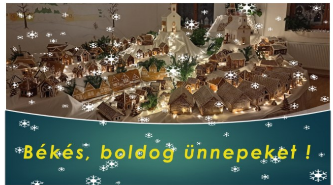
Békés, boldog ünnepeket !