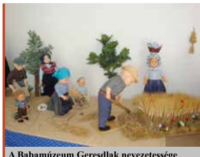
A Babamúzeum Geresdlak nevezetessége

nem egyszerű bababemutatásra készültek, annál egy kicsit többet szerettek volna. A babák és a népviseletek elkészítésén és bemutatásán túl az egykori falusi élet pillanatképeit részben gyermek- és ifjúkoruk életképeit szerették volna feleleveníteni. A Babavarró Körnek a tagjai olyan nyugdíjas asszonyok, akik nem csupán hordták egykor ezeket a ruhákat, hanem életük nagy részét e szokások közepette élték le. Így a ruhák készítésénél és az egyes életképek berendezésénél nagyon hathatósan tudtak segíteni tanácsaikkal. Csodálatosan szépek ezek a régi hagyományokat, ünnepnapokat, jeles eseményeket megőrökítő életképek. Munkájuk elismeréseként Geresdlak Község Önkormányzata Geresdlakért-díjjal jutalmazta, a Nemzeti Művelődési Intézet pedig Pro Cultura Minoritatum Hungarie elismerést adományozott a Babavarró Körnek. ■