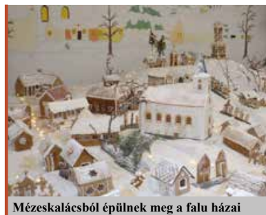
Mézeskalácsból épülnek meg a falu házai