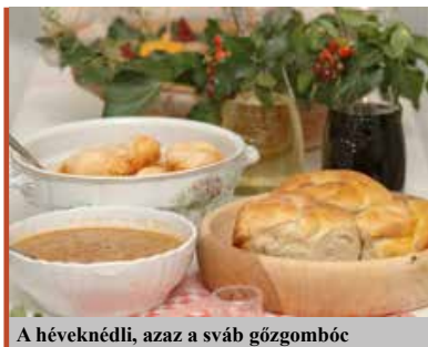
A héveknédli, azaz a sváb gőzgombóc