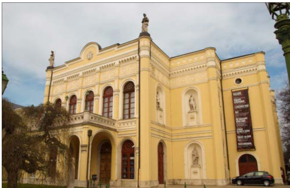
A debreceni Csokonai Színház épülete