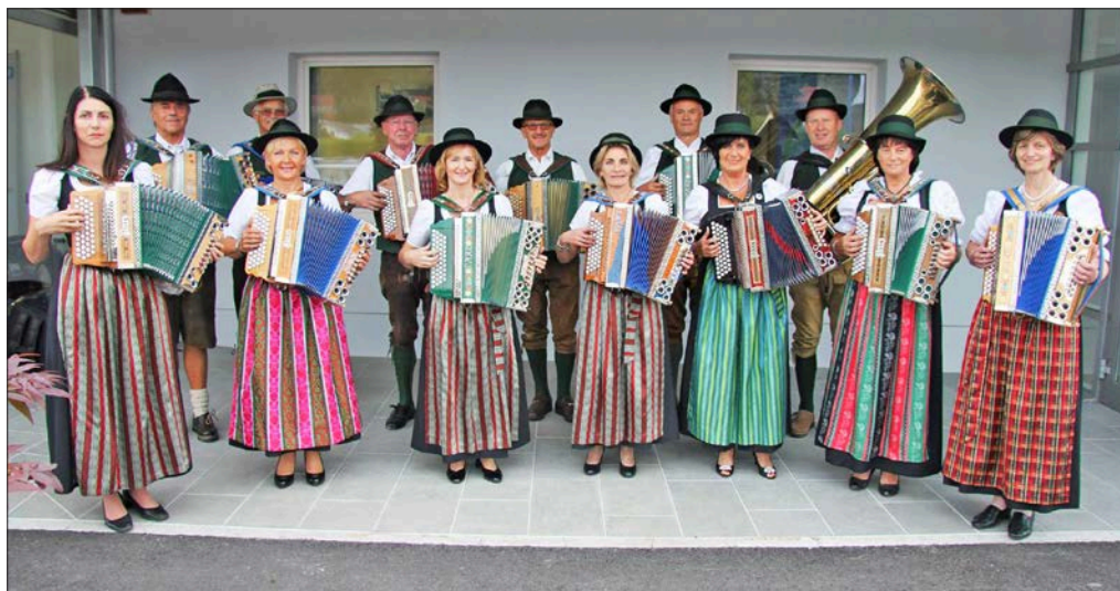
A Gőzgombóc-fesztivál sztárvendége a Die Bradlmsi Kanten 11 fős női osztrák harmonikás zenekara lesz