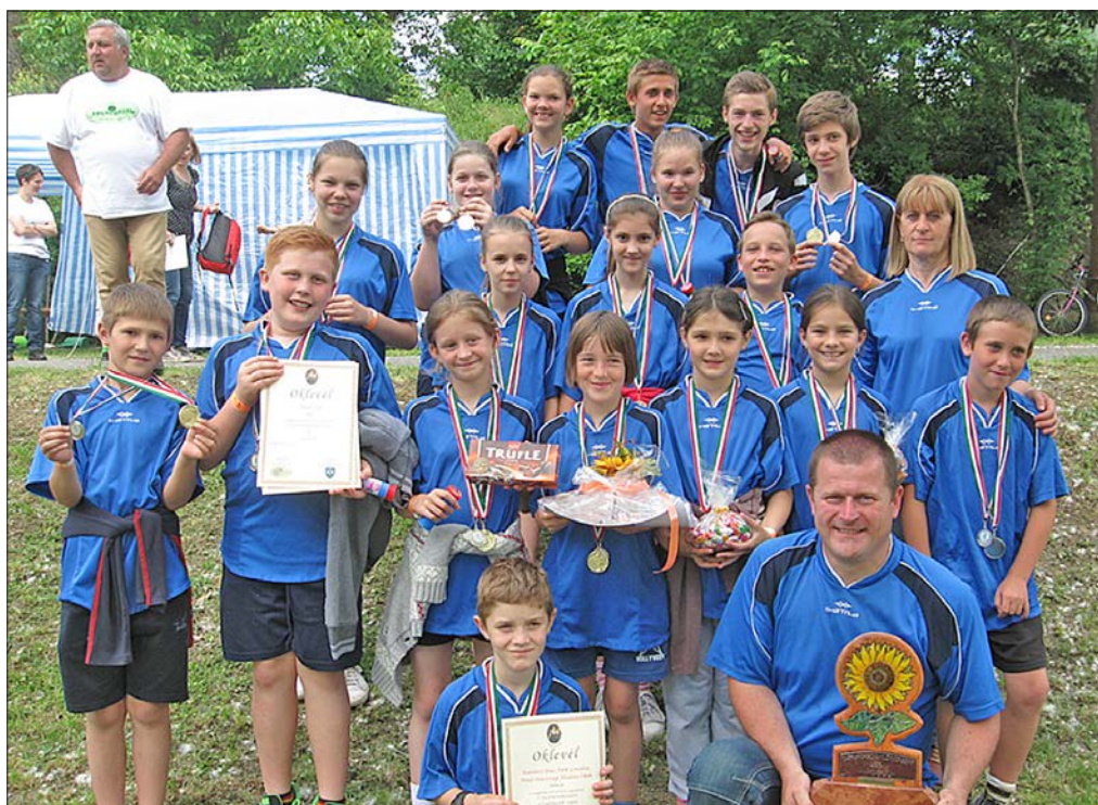
A 2015-ös Virágolimpia győztes geresdi csapata